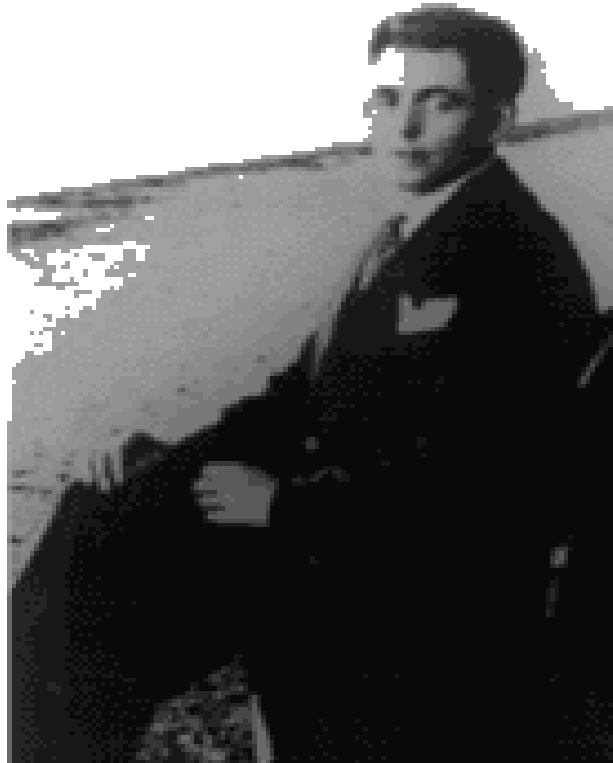
Johann Georg Elser (ermordet im April 1945 in Dachau)